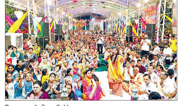
सिरसा। भजनों की प्रस्तुति देते भजन गायक।

■ श्रद्धालुओं ने भंडारे म प्रसाद भी ग्रहण किया