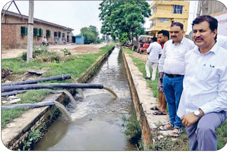
ऐसे हो रही निकासी : भूना शहर में जलभराव के लिए लगाई गई 4 इंची पाइपें।

पिछले कई दिनों से लगातार हो रही बरसात से फतेहाबाद में हालात भयावह से भयावह होते जा रहे हैं। वीरवार को जिले की पंजाब सीमा पर घग्गर नदी के चांदपुरा साइफन पर पानी का बहाव और बढ़ गया जबकि राजस्थान से सटे भद्र के गांव रामसरा में हिसार घग्गर मल्टीपर्पज लिंक चैनल टूटने से सैकड़ों एकड़ भूमि डूब गई। इस बीच वीरवार को भी भूना में भारी बारिश ने कोढ़ में खाज का काम किया। यहां पहले से ही डूबे भूना के लोगों के आंसू नहीं निकल रहे, बाकी कोई कसर रही नहीं। शासन-प्रशासन भूना से पानी निकालने में बिलकुल नाकाम रहा है। भूना के हालात जस के तस हैं। फतेहाबाद के विधायक ने डीसी की कार्यप्रणाली पर सवालिया निशान लगाते हुए सोशल मीडिया पर निशाना साधा है। पिछले कई दिनों से घग्गर में बढ़ रहे पानी से तटबंधों क्षेत्रों के लोगों की सांसें रुक-रुक कर आ रही हैं।