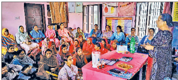
फतेहाबाद। ग्रामीण सभाओं को संबोधित करते हुए आशा वर्कर्स यूनिशन की पदाधिकारी।

कन्या भ्रूण हत्या के खिलाफ लोगों को जागरूक करने के उद्देश्य से आशा वर्कर्स यूनिशन हरियाणा द्वारा प्रदेशभर में शुरू किए गए जत्थे ने आज दूसरे दिन विभिन्न गांवों में सभाओं को संबोधित किया। जत्थे ने आज गांव अहरवां, एमपी सोत्र, राताथेह में ग्रामीणों को संबोधित किया। अभियान में आशा वर्कर्स के साथ सीएचसी का स्टाफ,