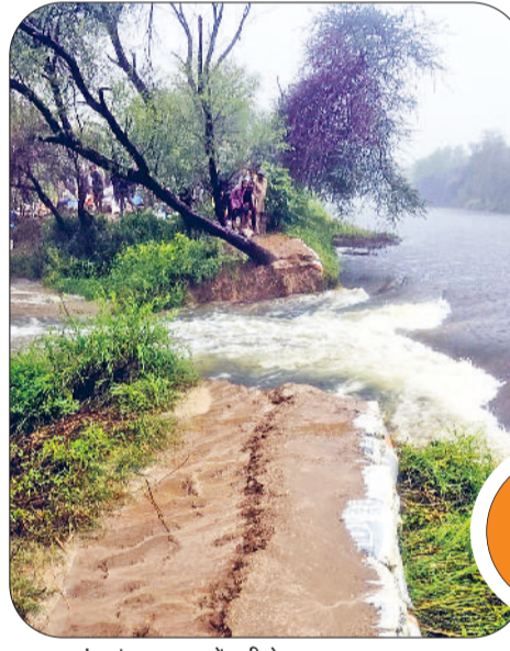
भद्रकलां। गांव रामसरा में टूटी ड्रेन।

वीरवार को यहां पर 14700 क्यूबिक पानी का बहाव दर्ज किया गया जबकि गुहला चौका में यह रिकार्ड स्तर 48534 तक जा पहुंचा। खनौरी में पानी का बहाव 13200 क्यूबिक दर्ज किया गया। बाढ़ से जूझ चुके जाखल क्षेत्र के बुजुर्ग किसानों का मानना है कि गुहला का पानी 36 घंटे बाद चांदपुरा में पहुंचता है। उनकी मानी जाए तो शुक्रवार दोपहर तक यहां पानी का बहाव 17 हजार क्यूबिक पार कर जाएगा। शनिवार तक यहां नदी खतरे के निशान को छू जाएगी। जिला प्रशासन इस स्थिति से कैसे निपट पाता है, यह एक बड़ा सवाल है। बता दें कि पंजाब के मुनक क्षेत्र से गुजर रही मुनक-खनौरी के कमजोर तटबंधों के चलते बीते वर्षों में शक्करपुरा रंगी नाले में आए पानी से फतेहाबाद तक बाढ़ आई। उधर, पिछले 24 घंटों में फतेहाबाद में करीब 40 से 50 एमएम बरसात होने से भूना में स्थिति जस की तस बनी हुई है। हाल यह है कि 4 दिन से पानी निकलने का नाम नहीं ले रहा। दरअसल पानी निकालने के लिए पुख्ता प्लान, पुख्ता इंतजाम व एक टोस रणनीति का अभाव होने के चलते खेतों का पानी भी अब भूना में आ रहा है। जितना पानी प्रशासन निकाल पाता है, उससे ज्यादा भूना में पानी आ जाता है। प्रशासन की दूरदृष्टिता के अभाव के हालात देखो एक पूरे शहर में पानी निकालने के लिए 4-4 इंची पाइपें लगाई गई हैं।