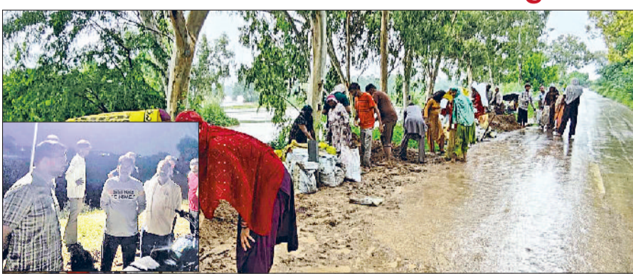
सिरसा। घग्गर के तटबंध पर रात को सुरक्षा व्यवस्था का जायजा लेते अधिकारी तथा तटबंधों की मजबूती को मिलाई गई गट्टे भरते ग्रामीण।