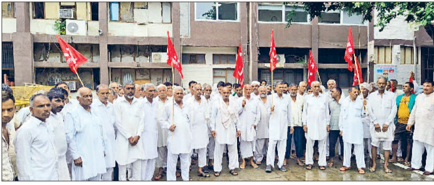
फतेहाबाद। मांगों को लेकर प्रदर्शन करते किसान।