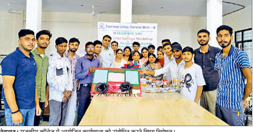
फतेहाबाद। राजकीय कॉलेज में आयोजित कार्यशाला को संबोधित करते विषय विशेषज्ञ।