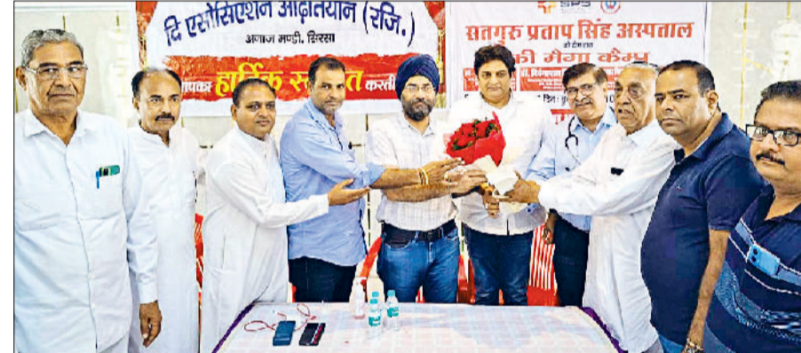
सिरसा। शिविर में सेवा देने पहुंचे चिकित्सकों का स्वागत करते आदतियान एसोसिएशन।

■ श्रद्धालुओं ने भंडारे म प्रसाद भी ग्रहण किया